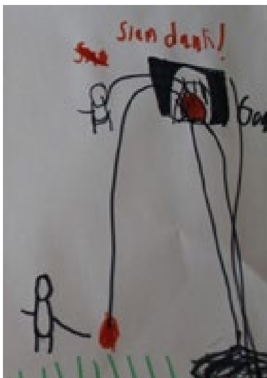
Ffigur 2: Colli gwneud chwaraeon yn ystod y cyfnod clo (Plentyn 15, Blwyddyn 3).

Dyweddodd y plant "nad oeddent yn cael mynd i unman" (Plentyn 11, Blwyddyn 1) a'u bod wedi "cholli mynd i rywle" (Plentyn 26, Blwyddyn Derbyn) yn ystod pandemig COVID-19. ac yn arbennig roedd y lleoedd hyn yn fannau lle byddai'r plant yn ymgymryd â gweithgareddau cyfoethogi. Er enghraifft, nododd y plant "Collais y ganolfan chwarae" (Plentyn 29, Blwyddyn 1), "Collais y traeth" (Plentyn 29, Blwyddyn 1) ac roeddent wedi colli "mynd i leoedd, fel canolfan laser" (Plentyn 5, Blwyddyn 1). Gellir gweld enghraifft o hyn yn ffigur 2 lle mae plentyn blwyddyn 3 wedi tynnu llun o'r campau (pêl-fasged) yr oedd yn eu colli.