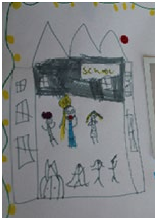
Ffigur 1: Colli ffrindiau (Plentyn 16, Blwyddyn 3).

Agwedd allweddol ar y thema o golli ac ymdeimlad o golled oedd colli pobl. Roedd yna bwyslais gwirioneddol ar fethu bod gyda chyfoedion a dywedodd nifer o blant: "Collais weld fy ffrind" (Plentyn 14, Blwyddyn 3). Yn ffigur 1 mae plentyn wedi tynnu llun o rai o'r pethau roedd yn eu colli, ac mae hyn yn cynnwys athrawon a ffrindiau o'r ysgol (gweler ffigur 1).