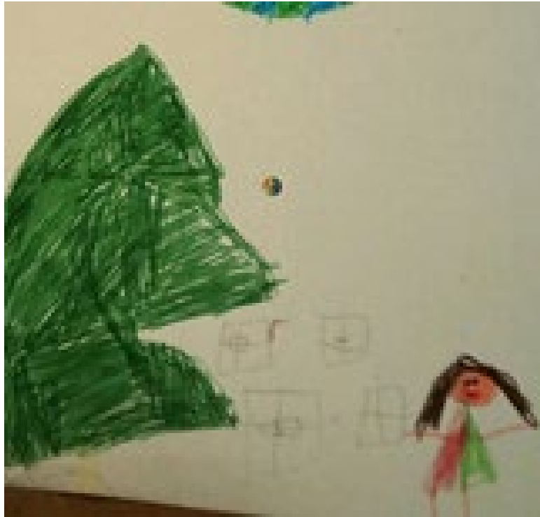
Ffigur 3: Llun plentyn o bwysigrwydd y Nadolig (Plentyn 21, Blwyddyn 1).

Ar yr un pryd, nododd y plant hefyd sut roedd technoleg ar-lein yn cefnogi rhyngweithio cymdeithasol a thrafodwyd sut y cafodd technoleg ei defnyddio i ddathlu digwyddiadau Nadoligaidd. Er i blentyn ddweud nad oedd yn mwynhau dymuno pen-blwydd hapus i bobl ar-lein a'i fod yn colli mynd i bartïon, roedd yn cydnabod bod technoleg o leiaf yn caniatáu iddyn nhw ddweud pen-blwydd hapus.