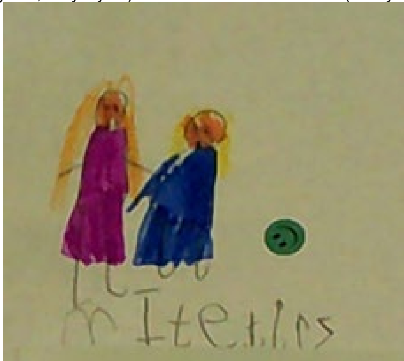
Ffigur 6: Plentyn yn colli ei hathro (Plentyn 20, Blwyddyn 2).

Nododd canfyddiadau cynharach [Adran 1.1 ac ati] fod plant wedi profi colli eu hathrawon tra bo'r ysgolion ar gau yn ystod pandemig COVID-19. Nododd rhai o'r plant "Rwy'n colli'r athrawon" (Plentyn 23, Blwyddyn 1) a "Collais rai o'm hathrawon" (Plentyn 3, Blwyddyn 1).