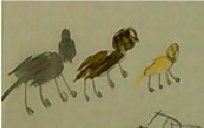
Ffigur 4: Llun plentyn o'i anifeiliaid anwes (Plentyn 20, Blwyddyn 2).